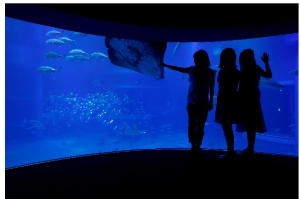
「夏休み おとなナイトツアー」(イメージ)

普段より少し暗い、静まり返った館内を歩き進めていく感覚は、まるで、大人だけの探検隊。夏の暑い時期に、ひんやりとしたロマンチックな夜の海を進んでいくかのような経験は、決して他では味わえません。