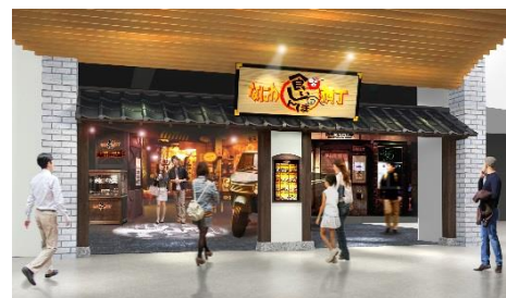
15 周年を記念したリニューアル (イメージ)

内容 “なにわグルメ”の老舗・元祖の飲食店を選りすぐり、一堂に集結させたフードテーマパークがおかげさまで 15 周年を迎えました。グルメだけでなく、楽しい仕掛けが満載の大阪の懐かしい街並みが新しくなります。（詳細は別途発表します）