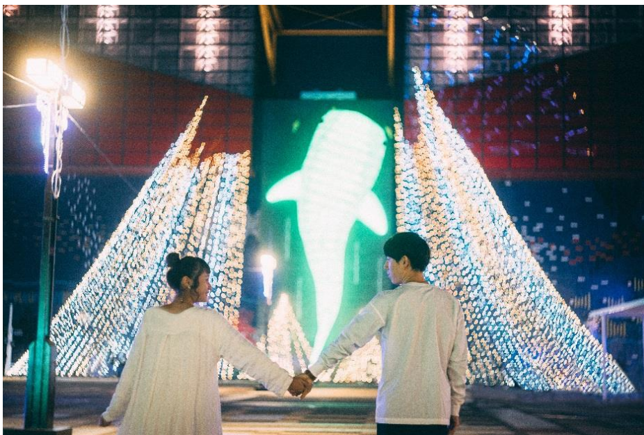
カップルインスタグラマーの2人が撮影したカップルフォト（モデルは本人）

大阪市港区の海遊館では、2017年12月3日（日）、10日（日）の計2回、思い出を素敵な写真で残したいふたりに向けた、「インスタグラマーに学ぶ、冬フォトワークショップ」を開催します。対象は高校生以上で、各回15組30名を募集します。冬の海遊館ならではの思い出づくりをお楽しみください。