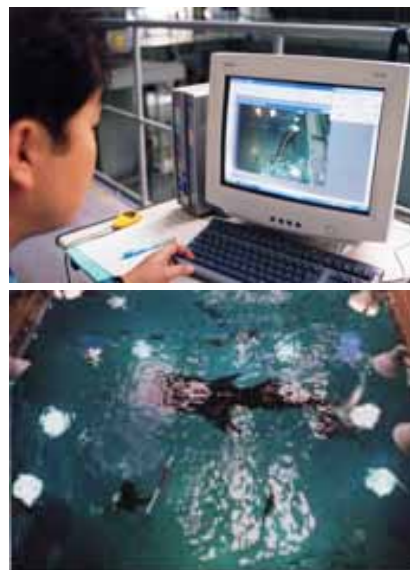
ジンベエザメの全長計測（過去の様子）

日 時 平成 19 年 6 月 22 日（金） 10：00～10：30 場 所 「太平洋」水槽バックヤード(8 階) 計測方法 飼育係員が「太平洋」水槽上部約 5m の位置にセ ットした計測用ビデオカメラで、1m の基準尺を撮 影し、長さをインプットします。この基準尺は長 さ約 1.5m の棒の中央部 1m を 50cm ずつ赤白に塗り わけており、ダイバーが水深約 1m に沈めたもので す。次に水中を泳いでいる「海くん」の姿を撮影 し、先にインプットした基準尺とコンピューター による画像処理によって全長を計測します。 また体重は、過去の計測値などを参考にして、 全長から推定します。