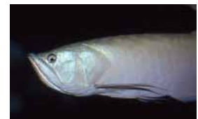
シルバーアロワナ

参加体験型の展示、解説方法となっていて、生き物の不思議な行動を、お客様は実際に体を使って楽しみながら理解していただくことができます。