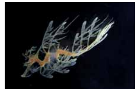
海遊館初展示「リーフィーシードラゴン」