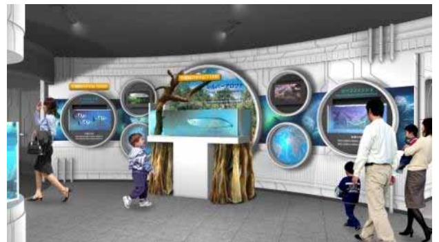
会場の様子 (イメージ)