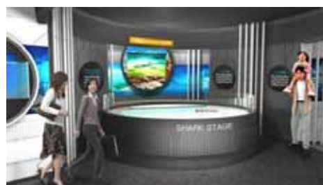
会場の様子（イメージ）

内 容 生き物の不思議な行動や、おもしろい行動にスポットをあてた特別企画展です。会場全体を「研究所」に見立て、お客様には研究員気分で展示をご覧いただきます。生き物の水槽をただご覧いただくだけでなく、各水槽の生き物の不思議な行動を、解説パネルや実際に撮影した超スロー映像などでご覧