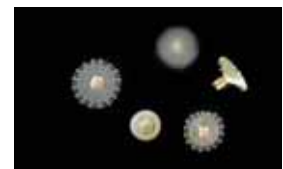
サカサクラゲ（エフェラ）