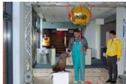
アシカの「リンちゃん」の練習風景