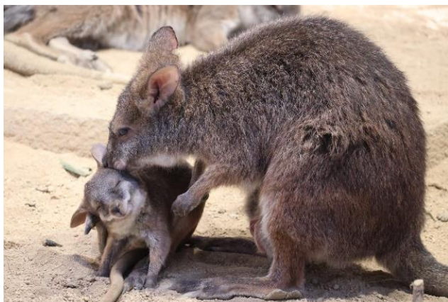
パルマワラビーの赤ちゃん「おはぎ」とお母さんの「あん」 (7月28日撮影)