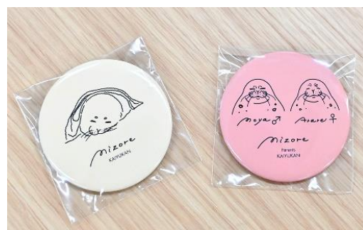
カプセルトイ「缶バッジ」