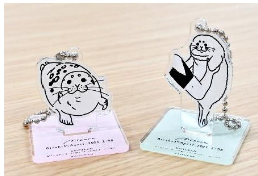
カプセルトイ「アクリルスタンド」