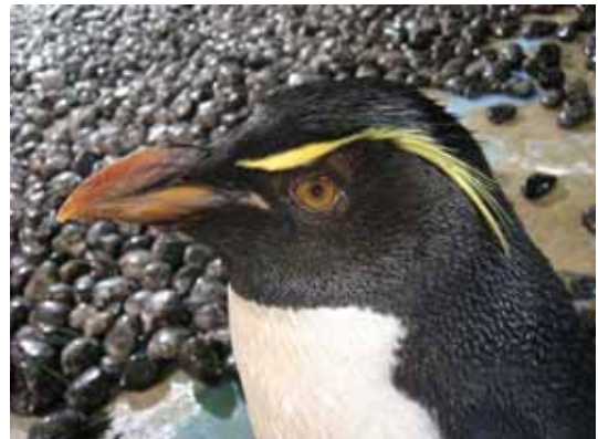
イワトビペンギン