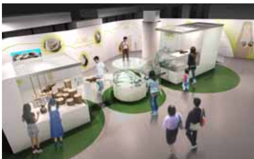
カウソライブ(イメージ)