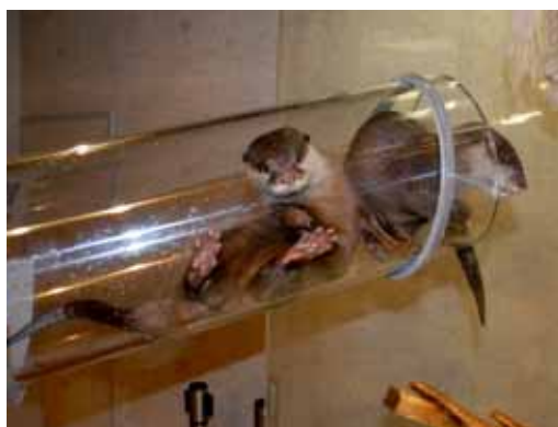
空中トンネルで遊ぶカワウソ (写真は「カワウソのひみつ」開催時のもの)