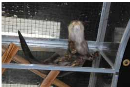
真下から見たコツメカワウソ (写真は「カワウソのひみつ」開催時のもの)

トンネル型水槽 1 基に 2 頭のコツメカワウソを展示し、カワウソの陸上、水辺でのそれぞれの様子を横や下からご覧いただくことができます。それぞれ普段は見ることのできない行動や、体の特徴をご覧いただけます。