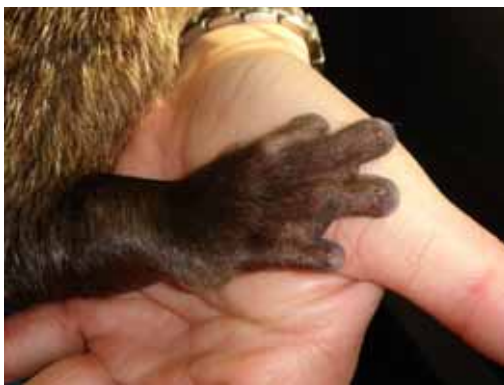
コツメカワウソの手（前肢）

カワウソの仲間では最も小型の種で、東南アジアに生息しています。四肢の指に小さく短い爪があることから、この名前がつけました。指先は器用で上手に物をつかむことができ、小魚やカエルなどの水生動物を食べます。日本には「ニホンカワウソ」という種が生息していますが、絶滅の危機に瀕しているといわれています。