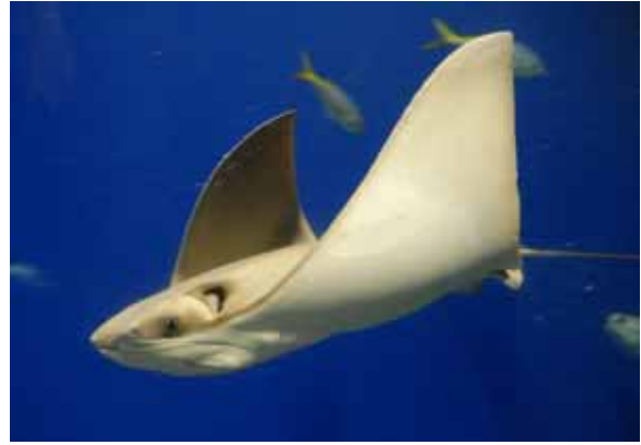
クロガネウシバナトビエイ

水中を飛ぶように優雅に泳ぎ、エビやカニなどの甲殻類、貝類を主食にしています。大西洋の熱帯から亜熱帯に生息しています。展示個体は体盤幅約 60cm。