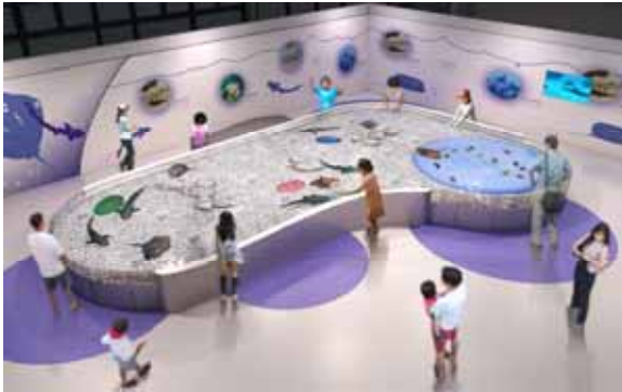
ふれあいライブ (イメージ)