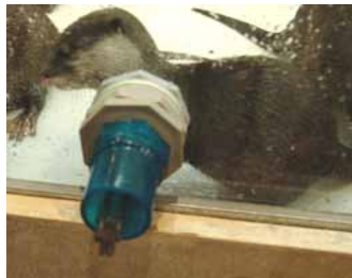
手（前肢）を出すコツメカワウソ (写真は「カワウソのひみつ」開催時のもの)