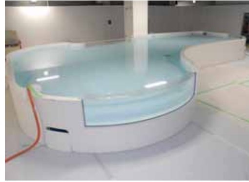
大型タッチングプール (製作中の実写写真)

海遊館では過去最大となる、全長10m×最大幅8m×深さ0.3mの大型タッチングプールにて、ホシエイ、トラフザメなどのサメ・エイ類の大型個体を合計約30匹、スズメダイの仲間を約500匹、合計約530匹飼育します。目の前まで泳いできた際には実際に触って、体表の感触を体感できるとともに、大型のサメやエイに触るハラハラ・ドキドキ感を味わっていただくことができます。