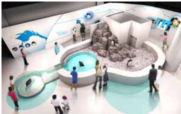
ペンギンライブ(イメージ)