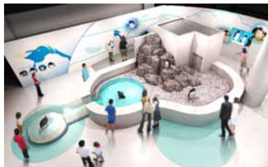
ペンギンライブ(イメージ)

一般公開に先駆けて、メディア関係者向けプレビューを 3 月 12 日(木)午前 9 時 30 分から 11 時まで開催いたしますので、ご取材いただければ幸いです。取材をご希望される方は当日午前 9 時 20 分に海遊館エントランスビル 2 階海遊館案内所前にお集まりください。この時刻以外にお越しになる場合は、海遊館広報課へご一報ください。