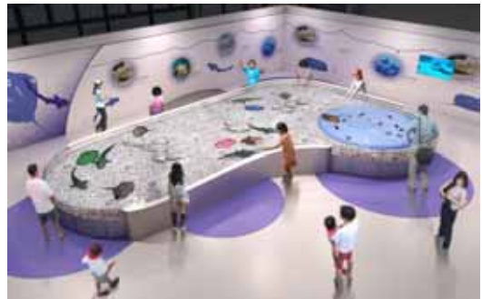
ふれあいライブ(イメージ)

会場内は「カワウソライブ」、「ふれあいライブ」、「ペンギンライブ」の 3 つのコーナーに分かれています。「カワウソライブ」ではカワウソたちの愛らしい仕草や、より活発な行動を間近でご覧いただけるほか、一日に 1 回、お客様がカワウソから“ さわ 触られる”体験も実施します。「ふれあいライブ」では、全長 10m×最大幅 8m×深さ 0.3m の大型タッチングプールにて、全長約 1m のトラフザメや体盤幅約 70cm のホシエイなど、大型のサメ・エイを約 30 匹飼育し、お客様にハラハラ・ドキドキのサメ肌体験をしていただけます。また「ペンギンライブ」は、イワトビペンギンとお客様の間を仕切るガラスがない、“ガラスレス”の行動展示となっており、イワトビペンギンの名前の由来でもある、岩の上をピョンピョンと飛び跳ねる様子や、泳ぎまわる様子を間近でご覧いただいたり、互いに鳴き交わす際の特徴的な鳴き声を聞いていただくことができます。