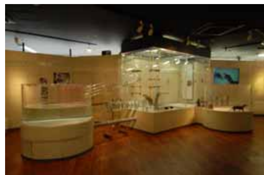
行動展示水槽 (写真は「カウソのひみつ」開催時のもの)