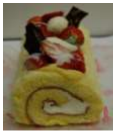
苺ミルクのロールケーキ