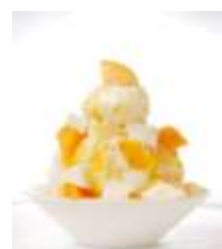
マンゴーチャイナ