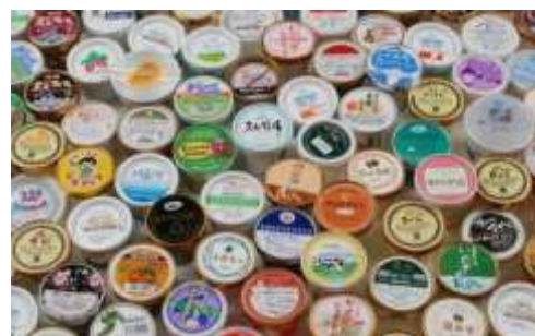
アイスパレード(イメージ)

北海道をはじめ、関東、四国、中部地方などから、ご当地自慢のソフトクリームやジェラート、日本各地からのご当地カップアイスが登場します。