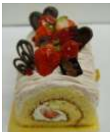
たっぷり苺のモンブラン