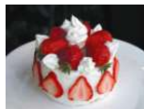
ストロベリースマイル