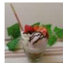
天保山オリジナルパフェ