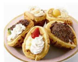
フレンチワッフル