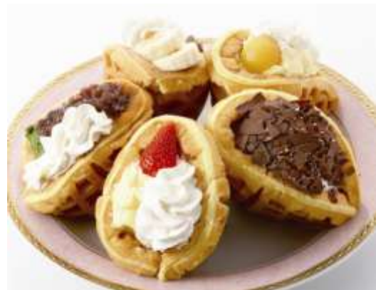
天保山スイーツアイランド(イメージ)

「天保山スイーツアイランド」は、期間を大きく 2 つにわけて開催します。まず、3 月 6 日（土）から 14 日（日）は、約 30 種類のロールケーキが登場する「ロールケーキコレクション」を開催します。約 30 種類のロールケーキを一堂に集め、見た目にも楽しんでいただけるほか、約 30 種類のうち 12 種類のロールケーキはカット販売もおこない、気に入ったケーキをその場で食べていただくことができます。さらに日替わりで、イチゴを中心とした春のフルーツを盛りだくさんに使用したロールケーキも登場します。