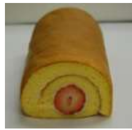
魔法のイチゴロール