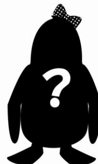
新キャラクターのシルエット