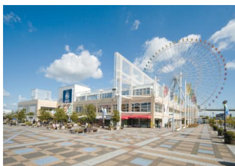
天保山マーケットプレイス外観

大阪市港区の海遊館に隣接する天保山マーケットプレイスでは、平成22年7月に天保山マーケットプレイスが開業20周年を迎えるにあたり、7月17日(土)以降、多彩な20周年記念イベントを実施する予定です。ついては実施予定イベントの概要が決定しましたのでご案内します。なお、個々のイベントスケジュール等については、開催が近づきましたら改めてお知らせします。