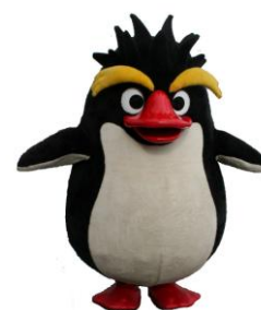
現キャラクターの「トビー君」

天保山マーケットプレース開業20周年を記念して、7月18日(日)に天保山マーケットプレース新キャラクターが誕生します。先輩キャラクター「イワトビペンギンの『トビー君』」とともに、様々なイベントに参加し、お客様とのふれあいや記念撮影などイベントを盛り上げます。 今回、天保山マーケットプレース新キャラクターの誕生に向けて、新キャラクターの愛称を募集します(7月5日(月)必着)。