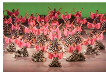
よさこいイメージ

20周年記念セレモニーとして、「よさこい」「吹奏楽ステージドリル」「チアガールステージ」などを実施します。また、過去に天保山マーケットプレースで実施したキッズダンスやゴスペルフェスティバル、サンバ女王コンテスト、フラクイーンコンテストなど、様々なコンテストの優勝者による記念ステージも実施します。