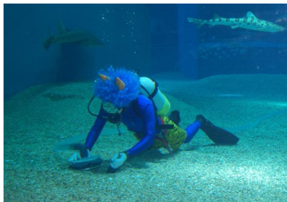
「オニさんダイバー」(過去の様子)

海遊館、天保山マーケットプレース、なにわ食いしんぼ横丁、天保山大観覧車は、平成24年1月17日(火)、18日(水)、19日(木)の期間、それぞれ休業させていただきます。取材についてもお受けできませんので、ご了承ください。