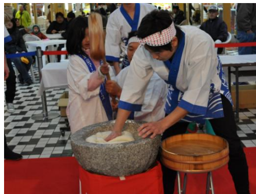
祝い餅つき&ふるまい餅のイメージ（昨年の様子）