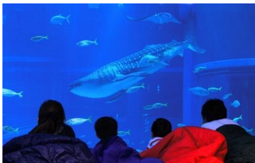
「グループでおとまり」の様子（イメージ）

2 日目は朝食の後、バックヤードのクラゲ飼育施設を見学後、開館前の海遊館に入館し、「太平洋」水槽を真上からご覧いただいたり、朝の生き物たちの様子や飼育係員の開館前の作業などを見学していただきます。