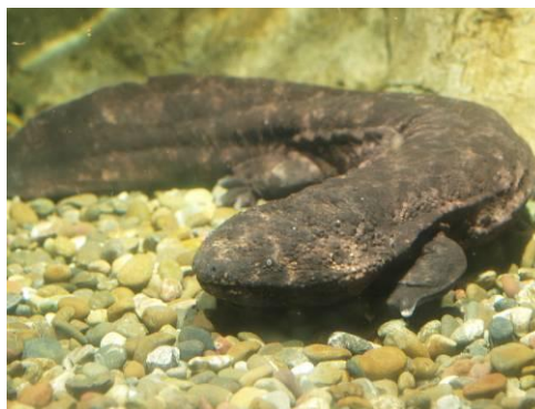
オオサンショウウオ（在来種）

海遊館では、固有種であるオオサンショウウオをはじめ、外来種の問題について、広く関心を持っていただけたらと考えています。