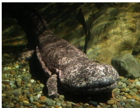
チュウゴクオオサンショウウオ（外来種）