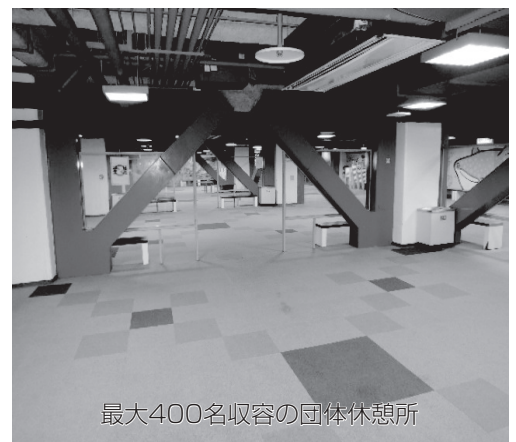
最大400名収容の団体休憩所

入館当日、皆様ご集合いただいてから、ご利用直前に団体受付までお申し出ください。順次、スタッフがご案内させていただきます(混雑時はお待ちいただく場合がございますのでご了承くださいませ)。ゴミは各自お持ち帰りいただくようお願いいたします。