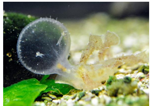
▲ムカデメリベが大きく口を開けて餌を食べる姿

体の形が非常にフシギなウミウシ。やや大型で、背中に大きな突起が並んでいます。大きな口を覆いかぶせるように使って、ヨコエビなどの小さな甲殻類を食べます。