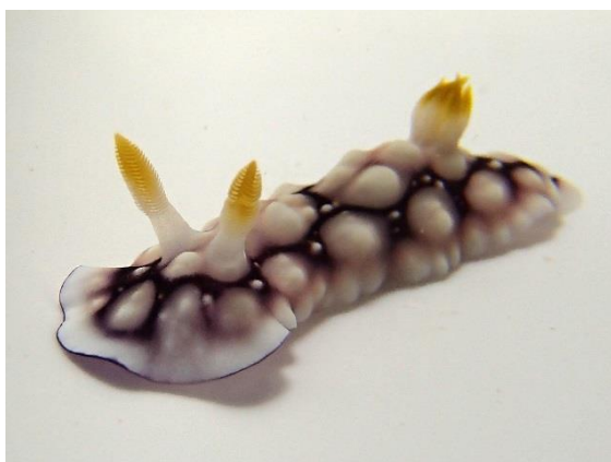
【キカモヨウウミウシ】体長約2cm

昆虫などは触角でまわりのものに触ることが多いですが、ウミウシの触角は水中の化学物質を感知するものなので、ここでおいをかいていると言えます。お尻のところにある花びら状の器官は二次えらといって、ここで呼吸をします。