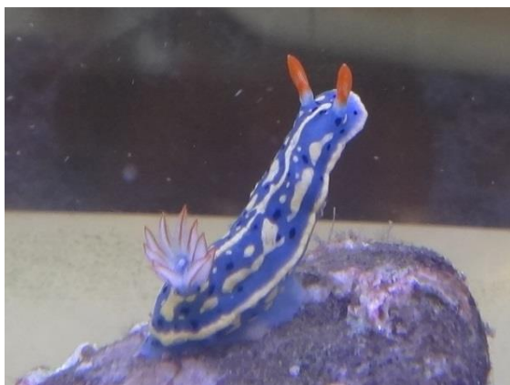
【アオウミウシ】体長約3cm