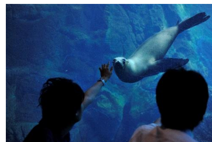
男性限定おとまりスクール アシカと遊ぶ様子 (イメージ)

場 所 海遊館 時 間 1日目 19:55 から (夕食は済ませてお越しください。) 2日目 9:30 まで (朝食をご用意します。朝食代は 参加費に含まれています。) 対 象 「女性限定おとまりスクール」 18歳以上の女性 (寝袋を持参できる方に限ります) 「男性限定おとまりスクール」 18歳以上の男性 (寝袋を持参できる方に限ります) 定 員 各回 40名 (計 200名) ※最小催行人数 25名に満たない場合は中止 参加費用 1名 7,000円 (税込み) 申込方法 往復はがき での応募です。