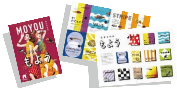
※リーフレットイメージ

冬は、クリスマスやお正月などおしゃれを楽しんでお出かけする機会が増える季節です。このイベントは人も真似したくなるようなおしゃれな生きものたちの“もよう”と、その名称の由来や生態、綺麗な色の“もよう”ができる仕組みにクローズアップするものです。