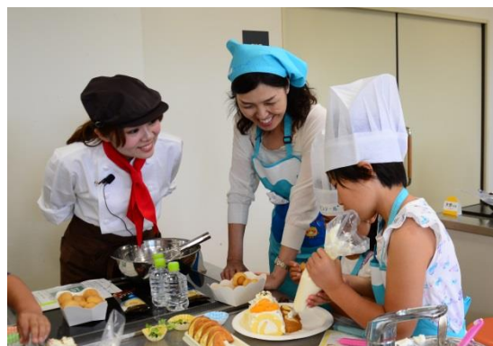
デコスイーツ体験講座（イメージ）