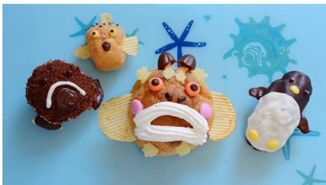
海の生き物デコスイーツ（イメージ）

コスイーツを作ります。海をイメージしたプレートに自由に作ったデコスイーツを並べて自分だけの海の世界を作ります。