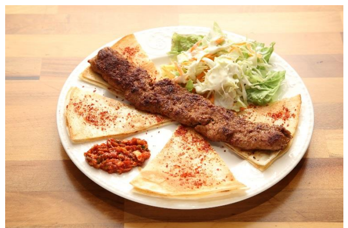
ケバブを中心としたハラールフード