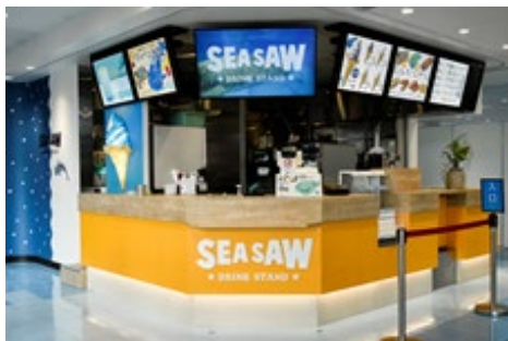
リニューアル後の「SEA SAW」

尚、リニューアルオープンを機に、ストロー、スプーン、レジ袋の一部を植物由来原料を主成分とした素材に変更しました。