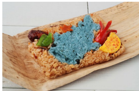
新メニューの「ジンベエ弁当」 価格：600円(税込)

(3) 海遊館オフィシャルミュージアムショップ ■2020年2月20日(木)リニューアルオープン(予定)