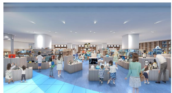
リニューアル後の店内(イメージ)

室内の床には青色のタイルをグラデーション上に貼り分け、太陽光が差し込む時間帯には、キラキラと照り返す水面を散歩しているような感覚でショッピングが楽しみいただけます。また、デザイナーとのコラボレーションによる新商品として、ペットボトルを100%再生利用して作られた「エコバッグ(サスティナバッグ)」や、海遊館の生き物をモチーフにした「折紙」などを販売します。