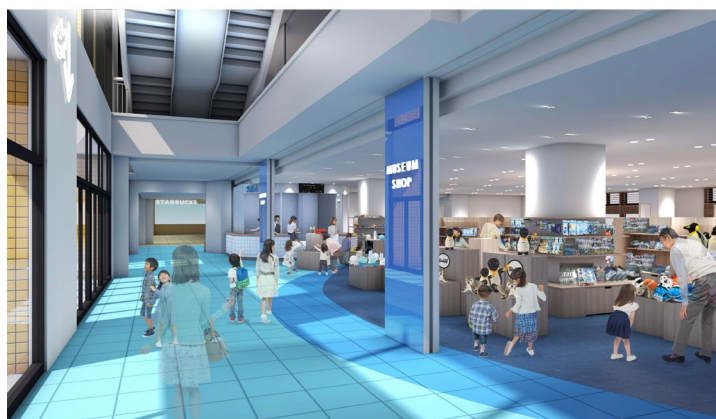
リニューアル後の海遊館オフィシャルミュージアムショップ周辺（イメージ）

この度、海遊館オフィシャルミュージアムショップの工事を終え、一連のすべてのリニューアルが完成いたします。