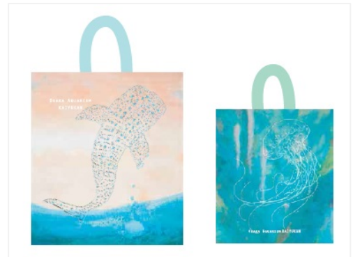
エコバッグ（イメージ）

尚、本商品はペットボトルを100%再生利用して作られた環境にやさしいバッグです。