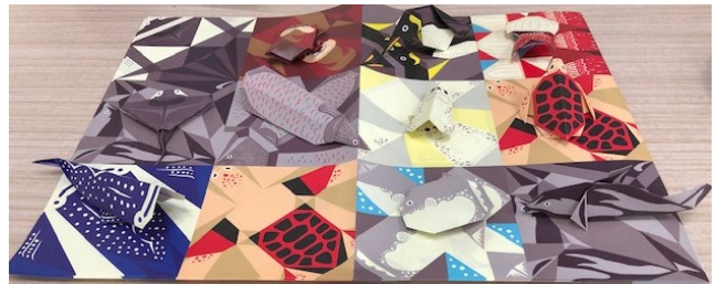
指人形折り紙 10種類入 650円（税別）