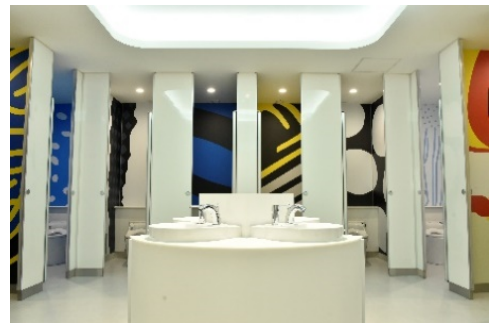
リニューアル後のトイレ

各トイレの個室の壁を、海遊館の「グレート・バリア・リーフ」水槽などで飼育している魚の模様を抽出したグラフィックで彩り、女性用トイレの個室数を10室から14室へと増加させました。また、パウダーコーナーとベビールームを新設しました。