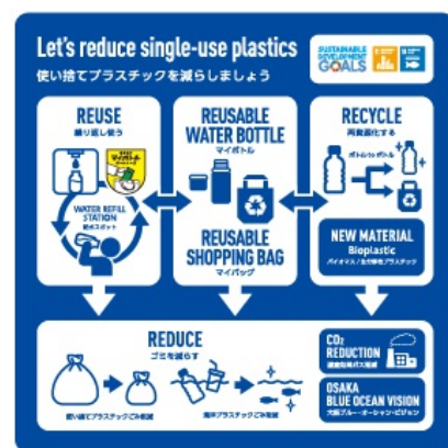
新たに展示するパネル（イメージ）