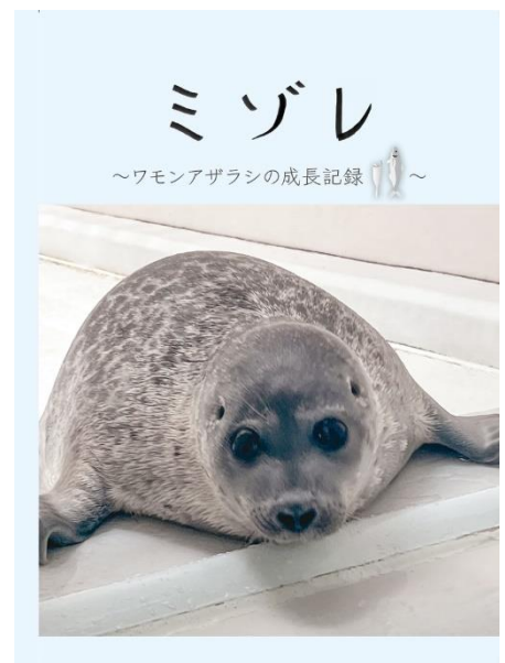
ミゾレ～ワモンアザラシの成長記録Ⅱ～ 表紙イメージ