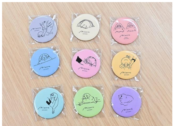
カプセルトイ「缶バッジ」