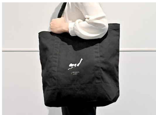
キャンバストートバッグ イメージ