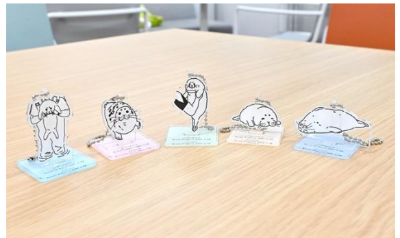
カプセルトイ「アクリルスタンド」

また、11月1日より「KAIYUKAN Official Shop Online」にてカプセルトイ「ミゾレ コンプリートセット」(缶バッジ×10柄+アクリルスタンド5柄、ばら売り不可)を販売します。