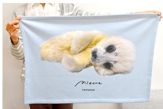
ミニブランケット ミゾレ イメージ