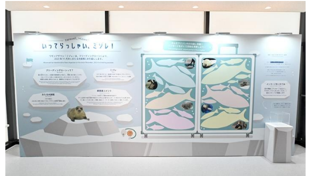
いってらっしゃいミズレボード

また、遠方で来館することが難しい方には FAX やお手紙の窓口も設け、SNS でもハッシュタグ「#いってらっしゃいミズレ」でファンアートやメッセージを募集しています。