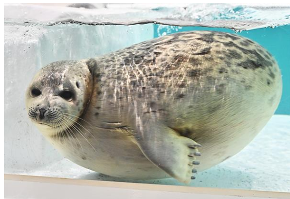
(2023 年 8 月 9 日撮影)