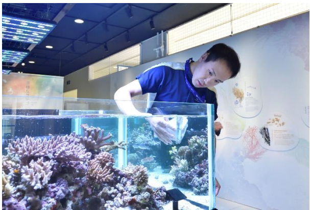
サンゴ飼育員体験