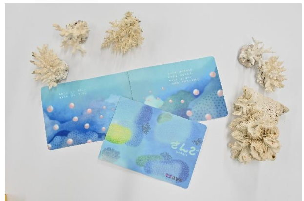
オリジナル絵本「さんごのおはなし」