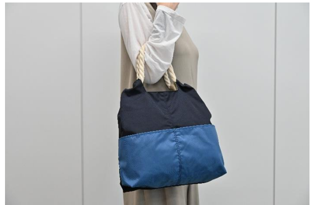
海にやさしい トートバッグ