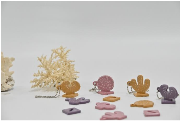
カラフルサンゴのキーホルダー