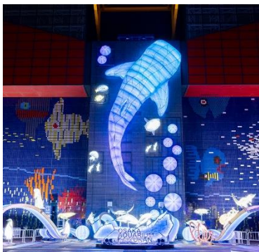
壁面の約16mのジンベエザメ