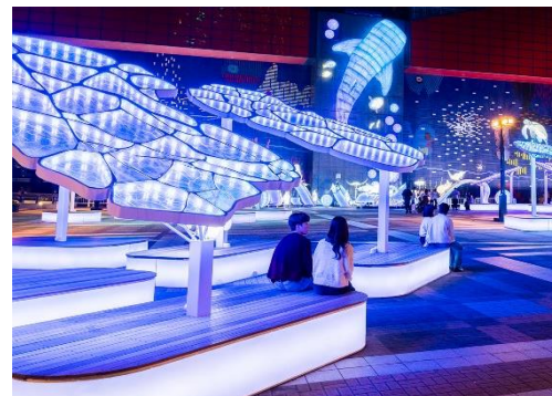
水面をイメージした屋根