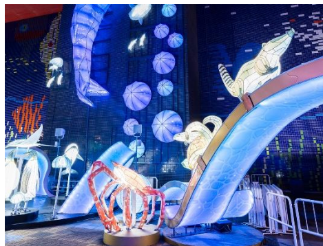
生きものたちのオブジェ