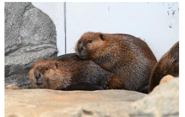
親子4頭で暮らすビーバーの仲睦まじい様子(一例)

キュレーターが選んだ、心温まる生きもののエピソード6選を、館内で配布するリーフレットでご紹介します。