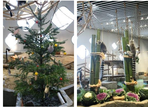
過去開催の様子(もみの木と門松)

またキュレーターが選んだ、心温まる生きもののエピソードも館内に設置するリーフレットでご紹介します。