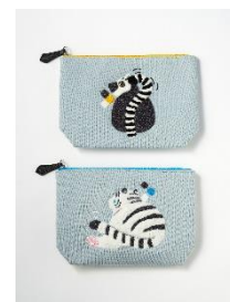
サガラ刺繍ポーチ