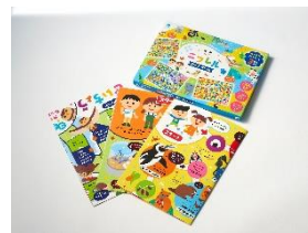
ニフレルボードゲーム