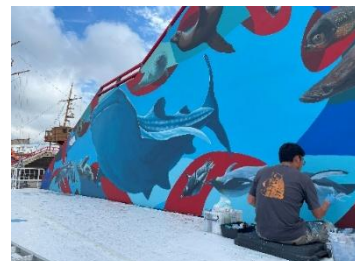
「フフフなウォールアート」 制作の様子