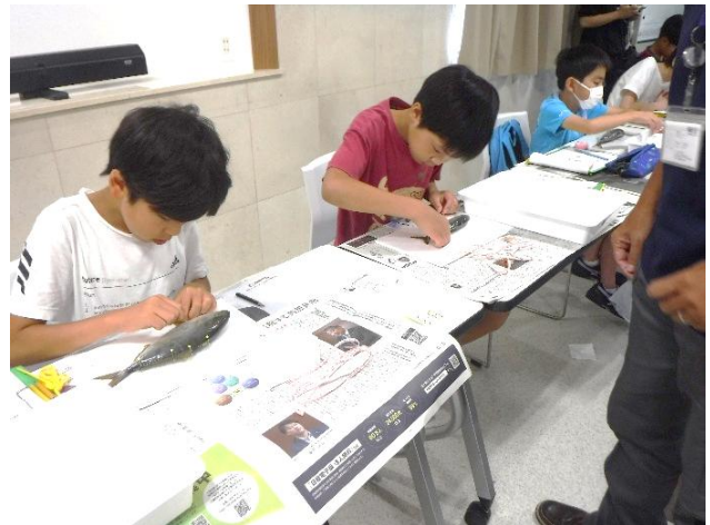
魚の解剖にチャレンジする様子

いろいろな特徴をもつ魚のからだを観察し、触るだけでなく飼育員のサポートを受けながら自分で魚の解剖にもチャレンジします。体の仕組みについて学び、「魚」という生きものについて学ぶスクールです。