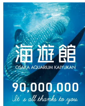
9,000 万人達成記念シール (タテ 90mm × ヨコ 72mm)

※9,000 万人達成直後から、当日ご入館いただいたお客様全員に「入館者 9,000 万人達成記念シール」をプレゼントいたします。