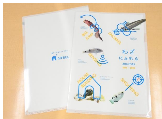
記念品:クリアファイル(A4 サイズ)

ニフレルはこれからも、生きものたちの多様性がもつ神秘さや不思議さをさまざまな角度から紹介し、訪れるたびに“感性にふれる”新しい発見が生まれる、“生きているミュージアム”をめざします。