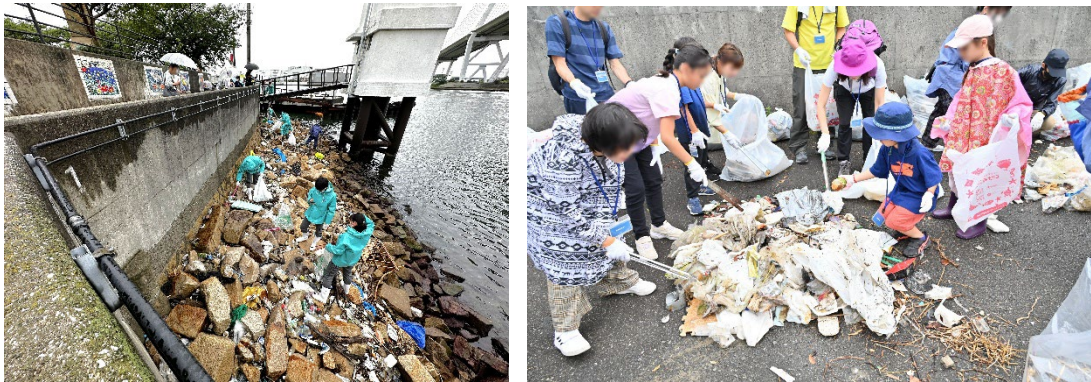
過去開催の様子（左：スタッフのごみ回収 右：参加者にごみを分別していただいている様子）

海遊館（大阪市港区）では、2026年6月6日（土）に環境啓発イベント「名探偵募集！海ごみの謎を追え！—海ごみはどこから？集めて、調べて、未来のアクションを考えよう！—」を、国連環境計画国際環境技術センター（UNEP-IETC）らと共同開催し、これに参加する小学生以上の方（20名）を募集します。