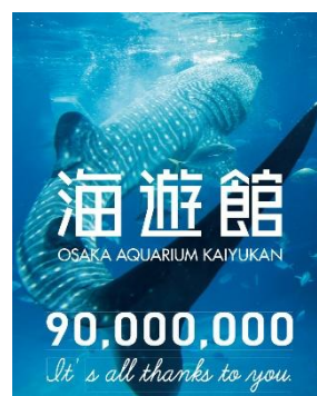
9,000 万人達成記念シール (タテ 90mm×ヨコ 72mm)

※9,000 万人達成直後から、当日ご入館いただいたお客様全員に 「入館者 9,000 万人達成記念シール」をプレゼントいたします。